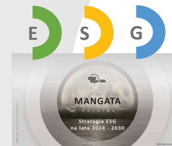
Strategia ESG Mangata Holding na lata 2024 - 2030

Wprowadzamy model zarządzania Grupą zgodny z wiodącymi standardami rynkowymi, zapewniający odporność Grupy na ryzyka ESG. Zagadnienia ESG uwzględniane będą w każdym istotnym obszarze naszej działalności.